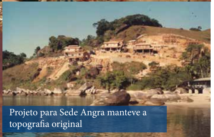
Projeto para Sede Angra manteve a topografia original