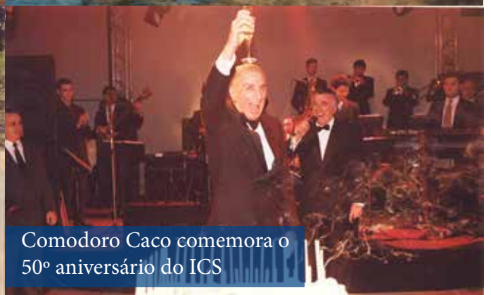
Comodoro Caco comemora o 50º aniversário do ICS