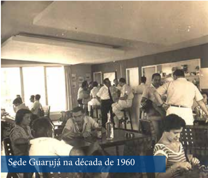
Sede Guarujá na década de 1960