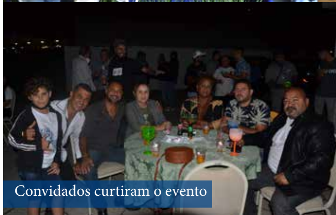
Convidados curtiram o evento