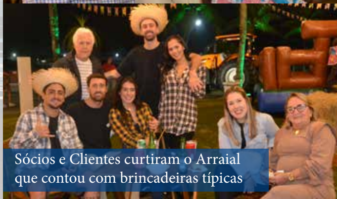
Sócios e Clientes curtiram o Arraial que contou com brincadeiras típicas