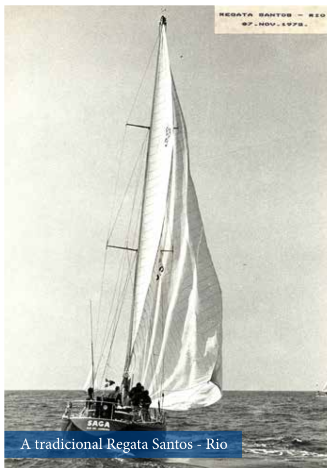
A tradicional Regata Santos - Rio