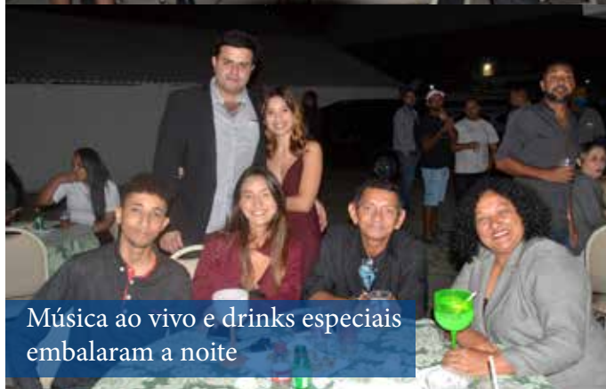
Música ao vivo e drinks especiais embalararam a noite