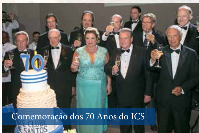
Comemoração dos 70 Anos do ICS