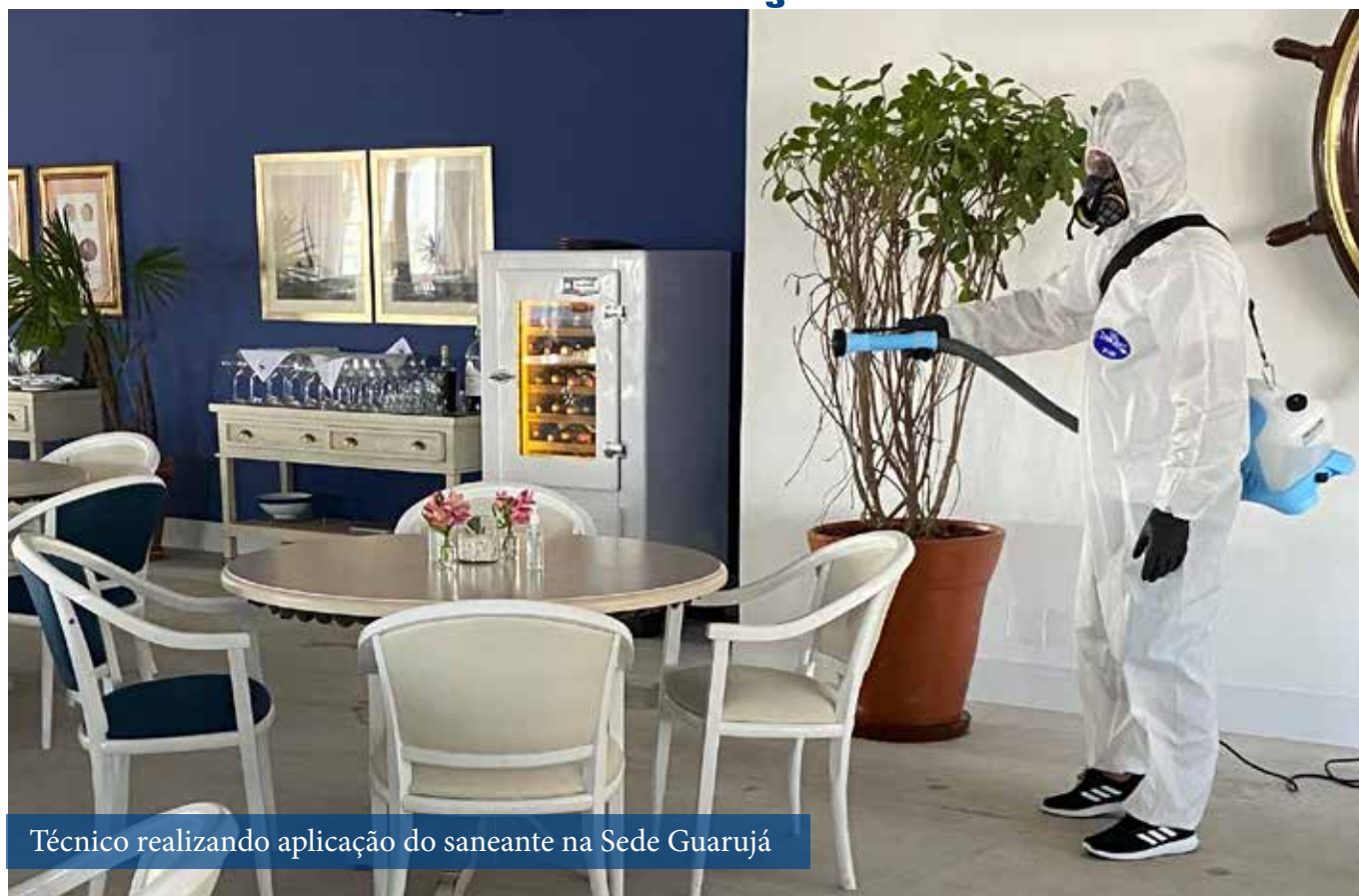
Técnico realizando aplicação do saneante na Sede Guarujá

Texto: BioForcis