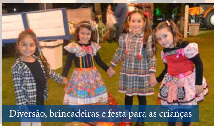
Diversão, brincadeiras e festa para as crianças