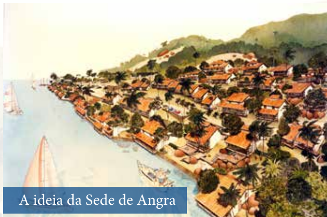
A ideia da Sede de Angra

relação ao meio-ambiente marinho. Resultado de uma administração que, desde o princípio, cumpre um serviço de excelência e exclusividade a seu quadro associativo, através dos ambientes finamente decorados, restaurantes privativos e serviços personalizados.