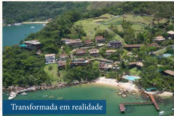
Transformada em realidade

No livro do clube, feito em comemoração ao