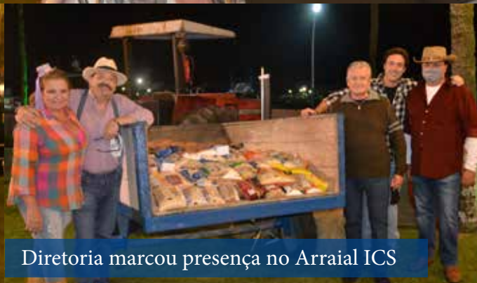
Diretoria marcou presença no Arraial ICS