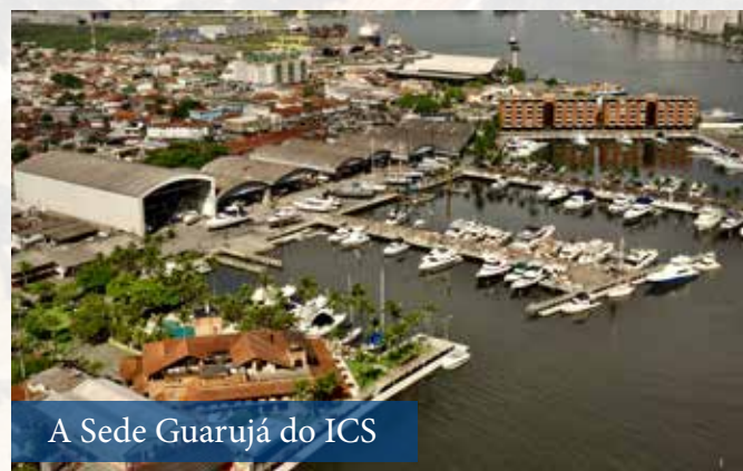
A Sede Guarujá do ICS