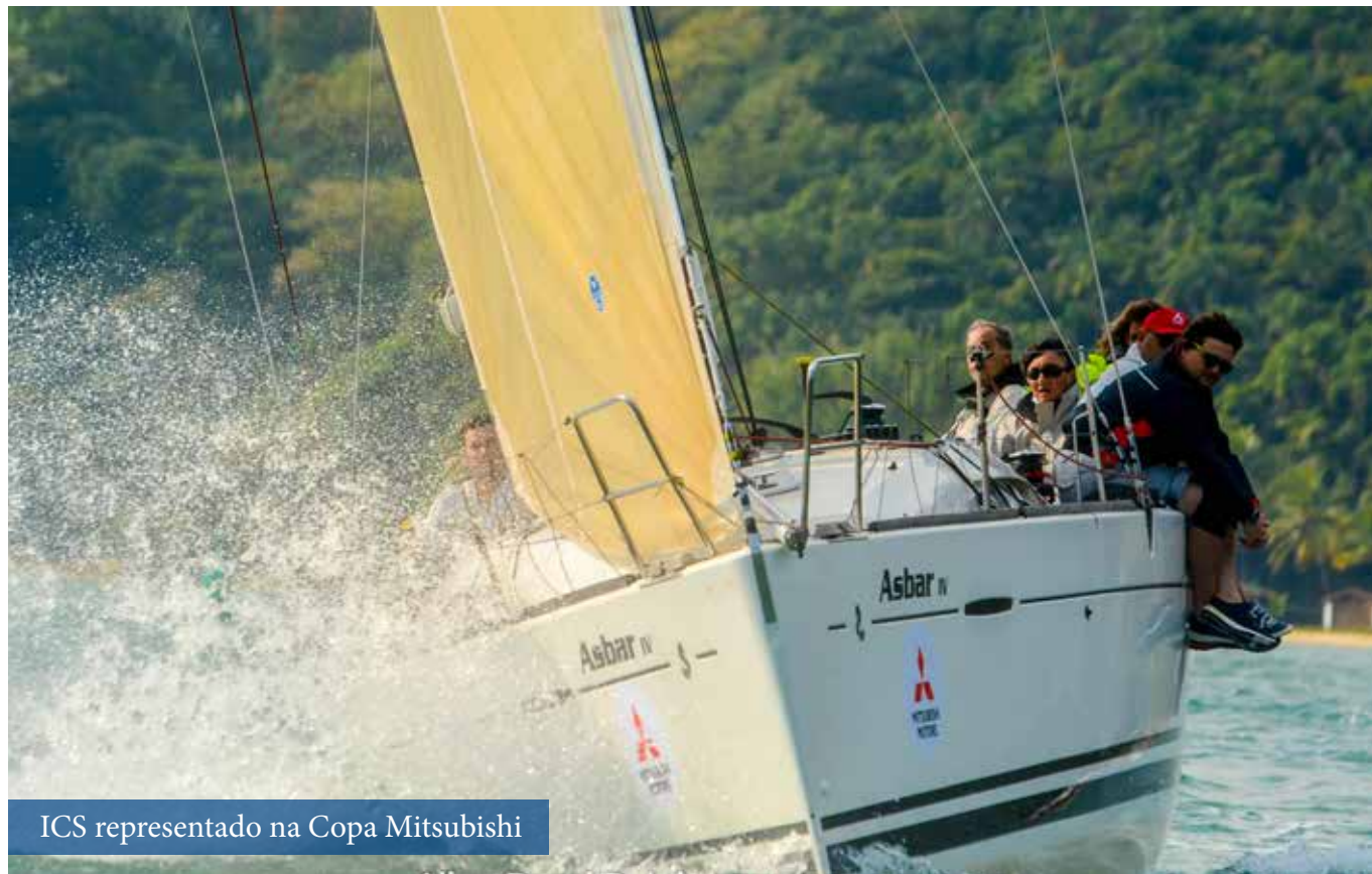
ICS representado na Copa Mitsubishi