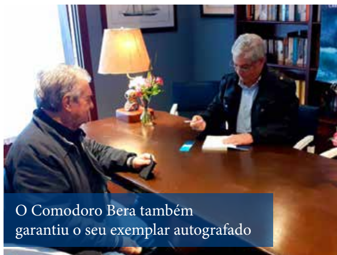
O Comodoro Bera também garantiu o seu exemplar autografado