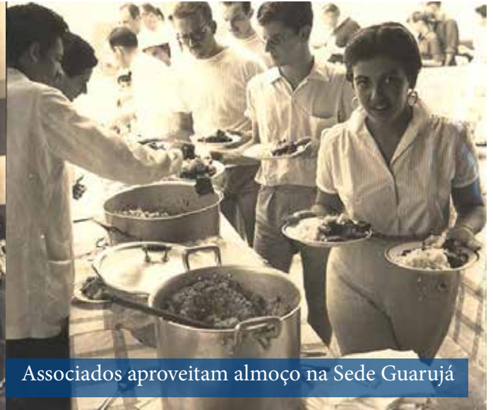
Associados aproveitam almoço na Sede Guarujá