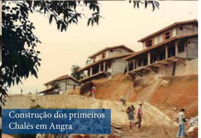
Construção dos primeiros Chalés em Angra