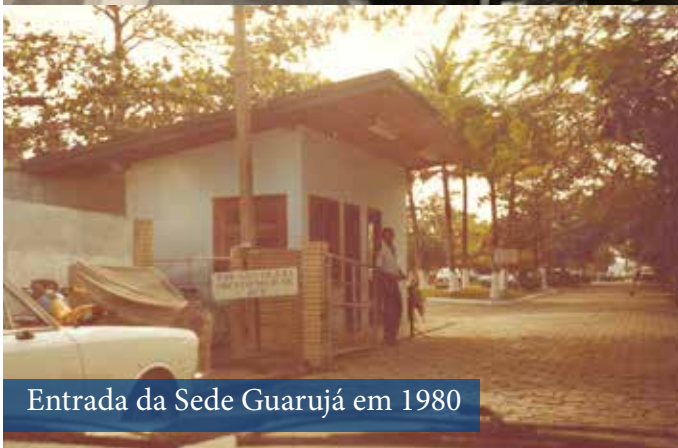
Entrada da Sede Guarujá em 1980