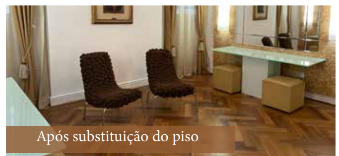
Após substituição do piso