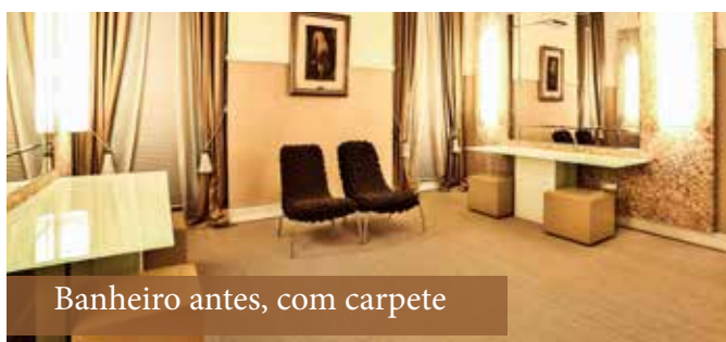
Banheiro antes, com carpete