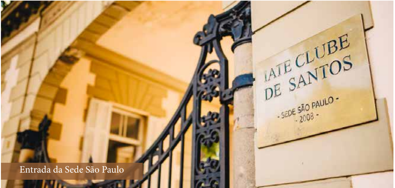
Entrada da Sede São Paulo