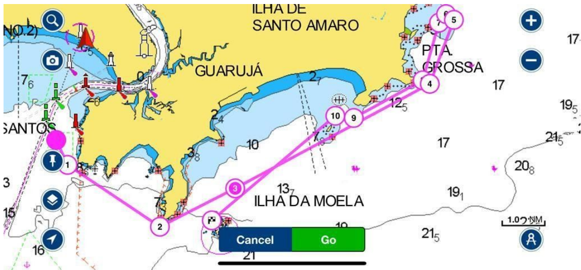
Legenda 2: Regata Arvoredos percurso RGS e CLÁSSICOS