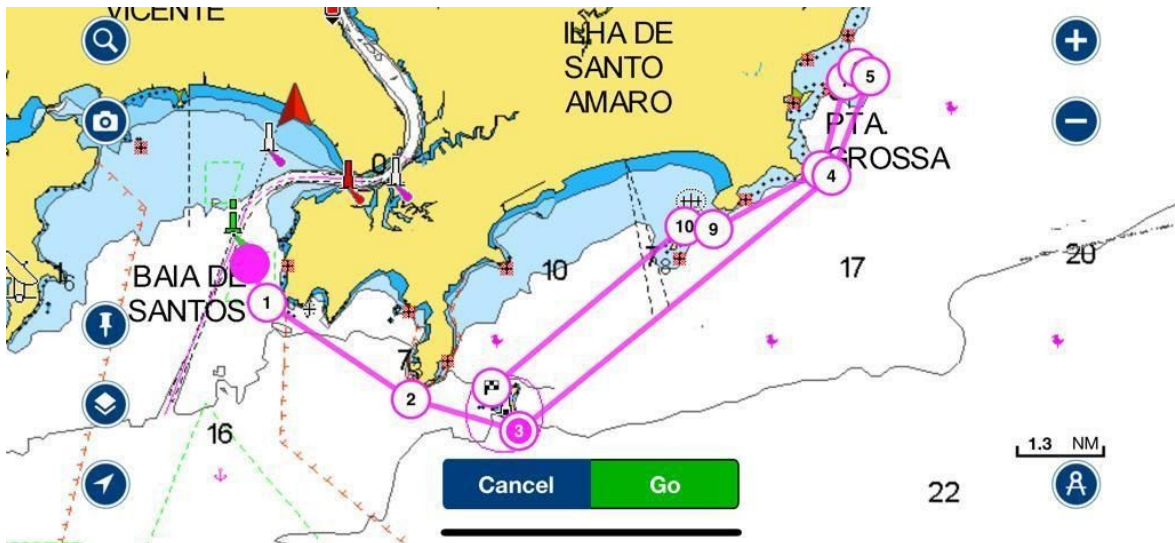
Legenda 1: Regata Arvoredos percurso ORC e IRC